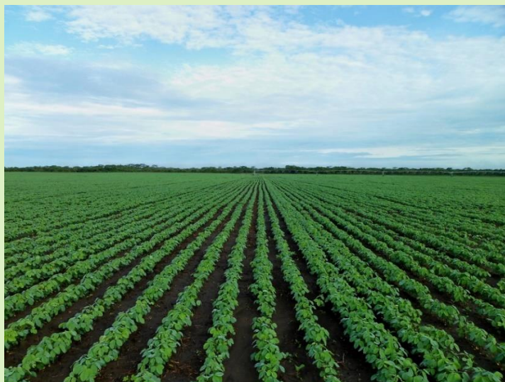
Figura 1 – Mais de 50% da produção mundial de soja vem da América do Sul.

Os regulamentos PAC (EC, 2013) não se aplicam à agricultura sul-americana, portanto, a melhor prática é dar prioridade à forragem de produção certificada na Europa, tanto no que diz respeito à biodiversidade como no que diz respeito a outras preocupações ambientais, como as emissões de Gases de Efeito Estufa (GEE) causadas pelo transporte.