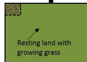
Intensive Rotational Grazing

Figura 1 – Tipos de sistemas de pastoreio, de acordo com o aumento da densidade de encabeçamento e da frequência de movimentos. Adaptado de: © The Pasture Project - Wallace Center (WC, 2019)