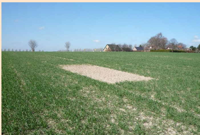
Abb. 1: Positives Beispiel eines flächigen Fensters, (dargestellt noch recht früh im Jahr) mit ausreichendem Abstand zu Fahrgassen und vertikalen Strukturen sowie dem Schlagrand.

Lerchenfenster innerhalb des Schlages, sind durch eine lichte und niedrige Vegetation ausgezeichnet.